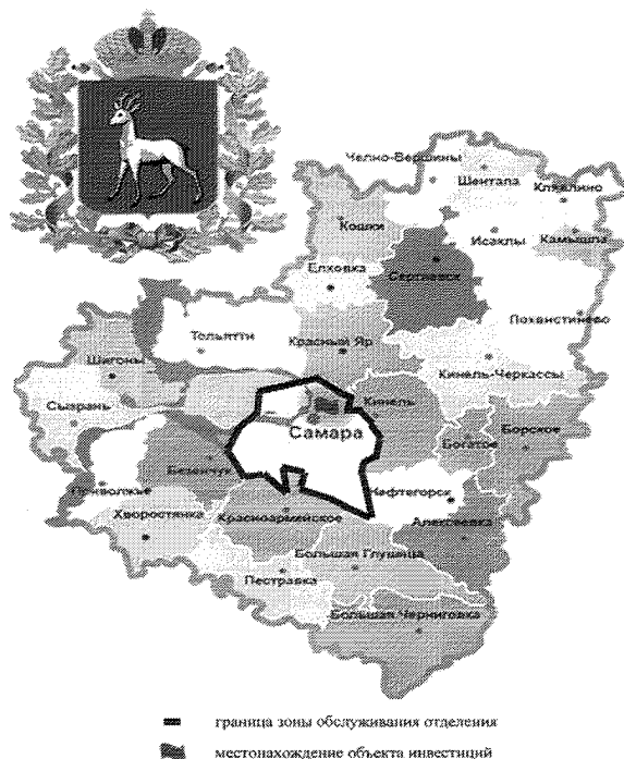
Карта-схема объекта инвестиционного проекта г. Самара

Заместитель директора по техническим вопросам